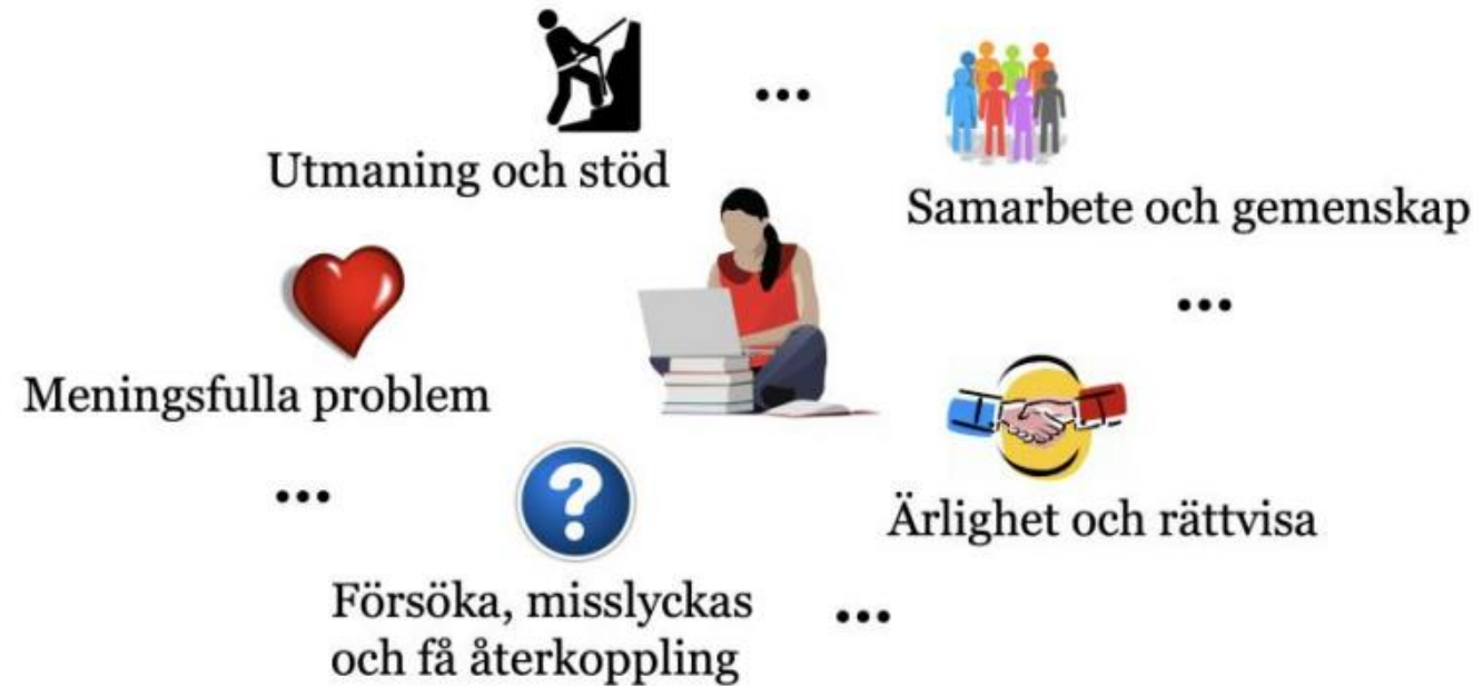
Figur 2. Illustration av studentens lärmiljö och exempel på lärfaktorer.