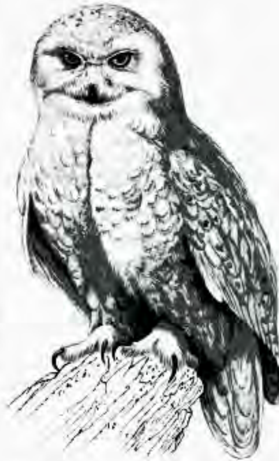
Fig 2. Draw the rest of the damn Owl