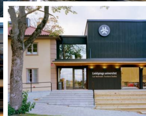
Malmstens (Lidingö), 70 studenter