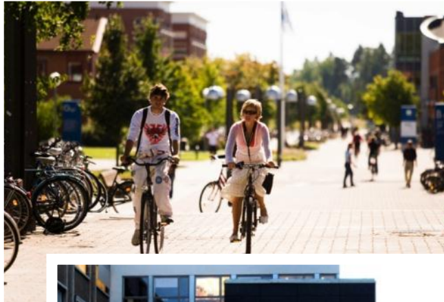
Campus Valla, 18 000 studenter