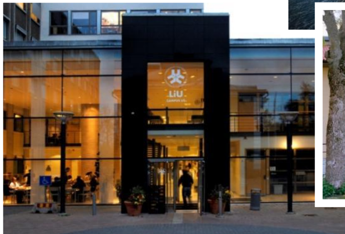
Campus US (Universitetssjukhuset), 3 000 studenter