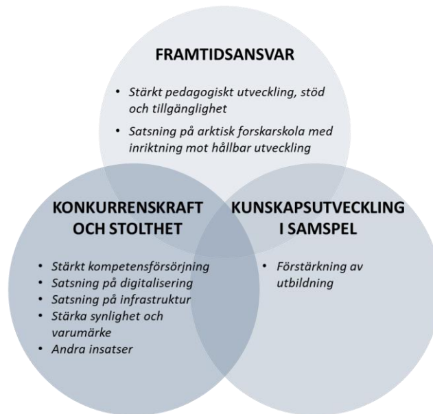
Figur 1. Områden där insatser i syfte att stärka forskning och utbildning planeras.

Satsningen omfattar totalt 315 miljoner kronor för perioden 2021–2025, fördelat med 35 miljoner kronor år 2021 (halvårseffekt) samt 70 miljoner kronor per år 2022–2025, och kommer att vara differentierad mellan fakulteterna/motsvarande utifrån respektive behov. Finansiering av satsningen sker genom användande av myndighetskaper på universitetsgemensam nivå, det vill säga ett universitetsgemensamt underskottskonto.