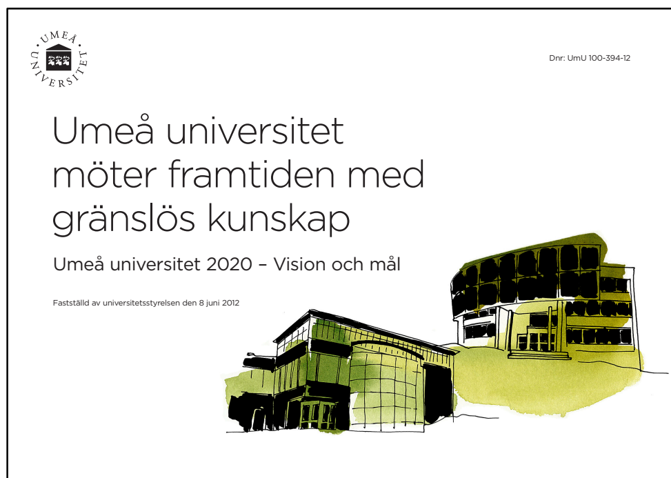
Bilder från Umeå universitet 2020 – vision och mål

Fakulteter, Lärarhögskolan, Universitetsförvaltning och Universitetsbibliotek avgör själva om de delmål som inte har angetts som obligatoriska ska ingå i deras egen verksamhetsplan eller ej. Delmål som inte är obligatoriska följs upp på universitetsgemensam nivå och ingår inte den uppföljning som samtliga organisatoriska enheter omfattas av genom universitetsgemensam modell respektive mall.