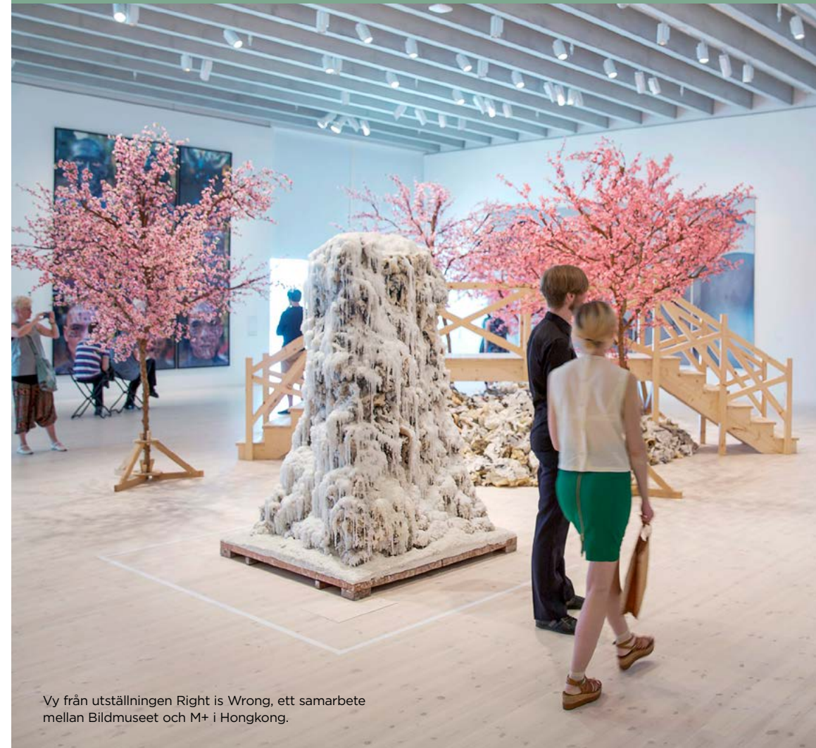
Vy från utställningen Right is Wrong , ett samarbete mellan Bildmuseet och M+ i Hongkong.