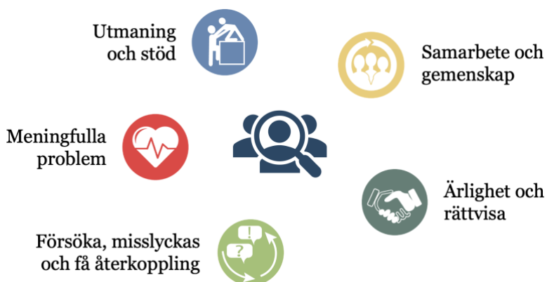
Figur 2. Illustration av studentens lärmiljö och exempel på lärfaktorer.

besvara. 4 Dessa frågor är mycket viktiga för att fånga upp mer specifika erfarenheter av och synpunkter på kursen. Som regel krävs inget ytterligare för att utvärdera din kurs, men du kan behöva använda LEQ en gång för att själv se att så är fallet.